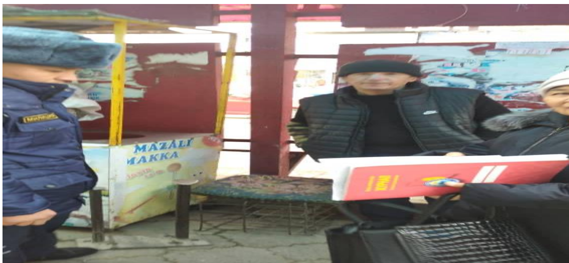
Үйүнө барган учур